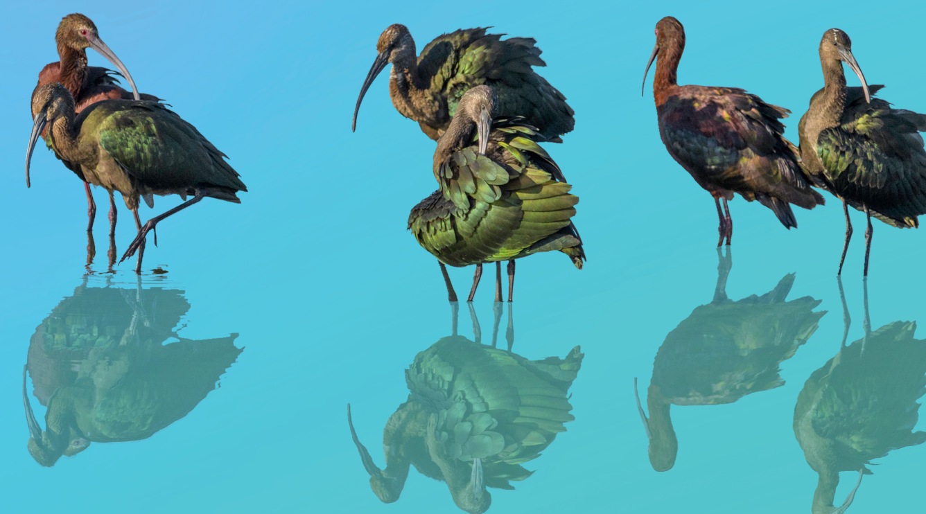
Ibis Ojos Rojos.