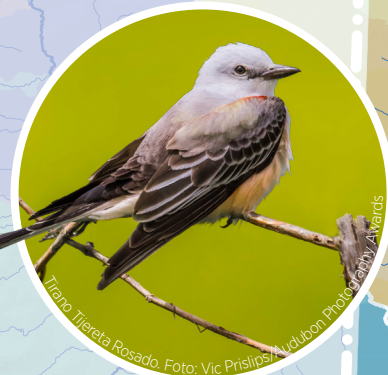
Águila Blanca.