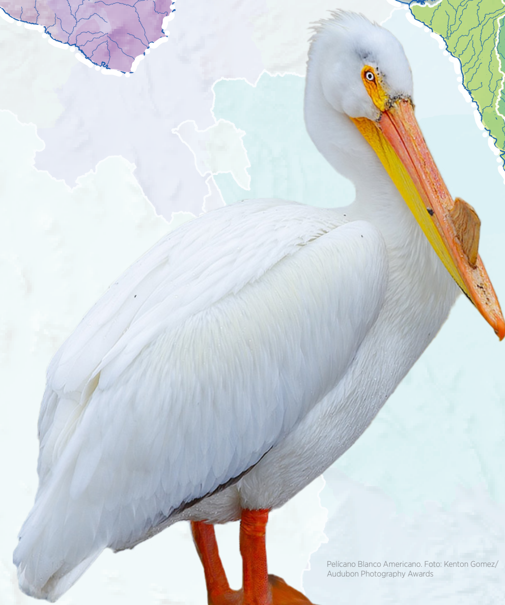
Pellicano Blanco Americano.

Todas las cuencas de los ríos costeros de Texas desembocan en estuarios y bahías donde las aves anidan, hacen una parada durante las migraciones y encuentran un refugio seguro para pasar el invierno. Audubon presta islas de aves en todas las cuencas costeras. Lo que comienza adentro en la tierra afecta lo que sucede en la costa.